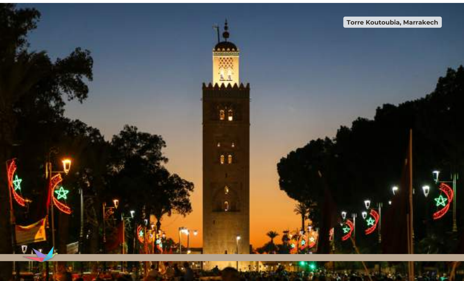
Torre Koutoubia, Marrakech

Desayuno buffet en el hotel. A la hora indicada traslado al aeropuerto con asistencia de habla hispana.