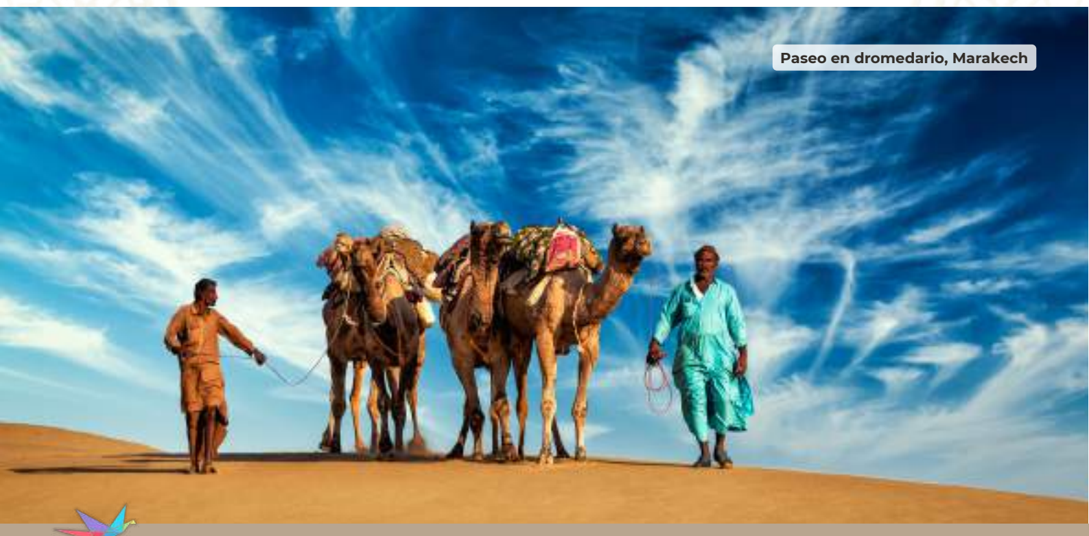
Paseo en dromedario, Marakech

Desayuno buffet en el hotel. Por la mañana salida para realizar la visita del Valle de Ourika, se encuentra a 60 kilómetros de Marrakech. Formado por las aguas torrenciales que provienen del Oukaïmeden, es una zona fértil, con pueblecitos de casas de adobe que cuelgan de las laderas de las montañas del Atlas, con paisajes pintorescos que fascinan a quien los visita. Los bereberes, pobladores del valle, siguen manteniendo sus costumbres y su tradicional sistema de vida a pesar de estar tan cerca de Marrakech. Durante la excursión visitaremos una de las casas bereberes, lo que permitirá involucrarse un poco más en la peculiar forma de vida de sus gentes. Almuerzo en un restaurante local. Por la tarde nos dirigiremos a la zona del Palmeral de Marrakech para que puedan realizar una de las actividades más típicas, disfrutar de un paseo en dromedario durante 40 minutos. Cena y alojamiento en el hotel.