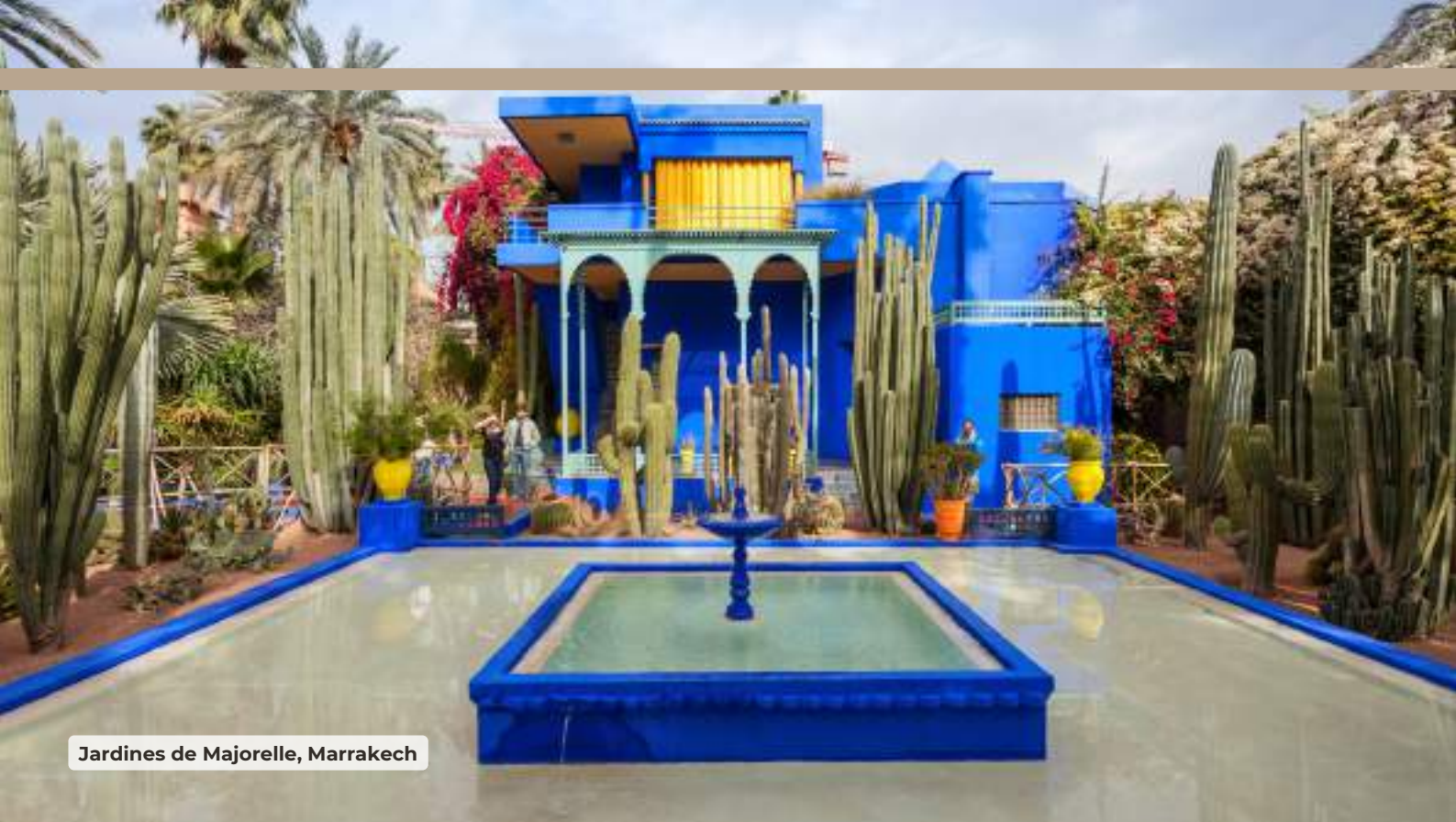
Jardines de Majorelle, Marrakech