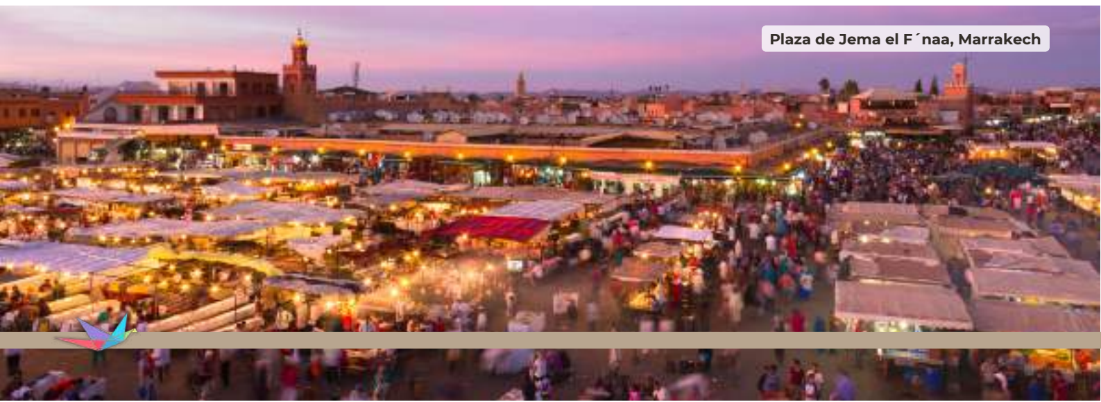
Plaza de Jema el F'naa, Marrakech