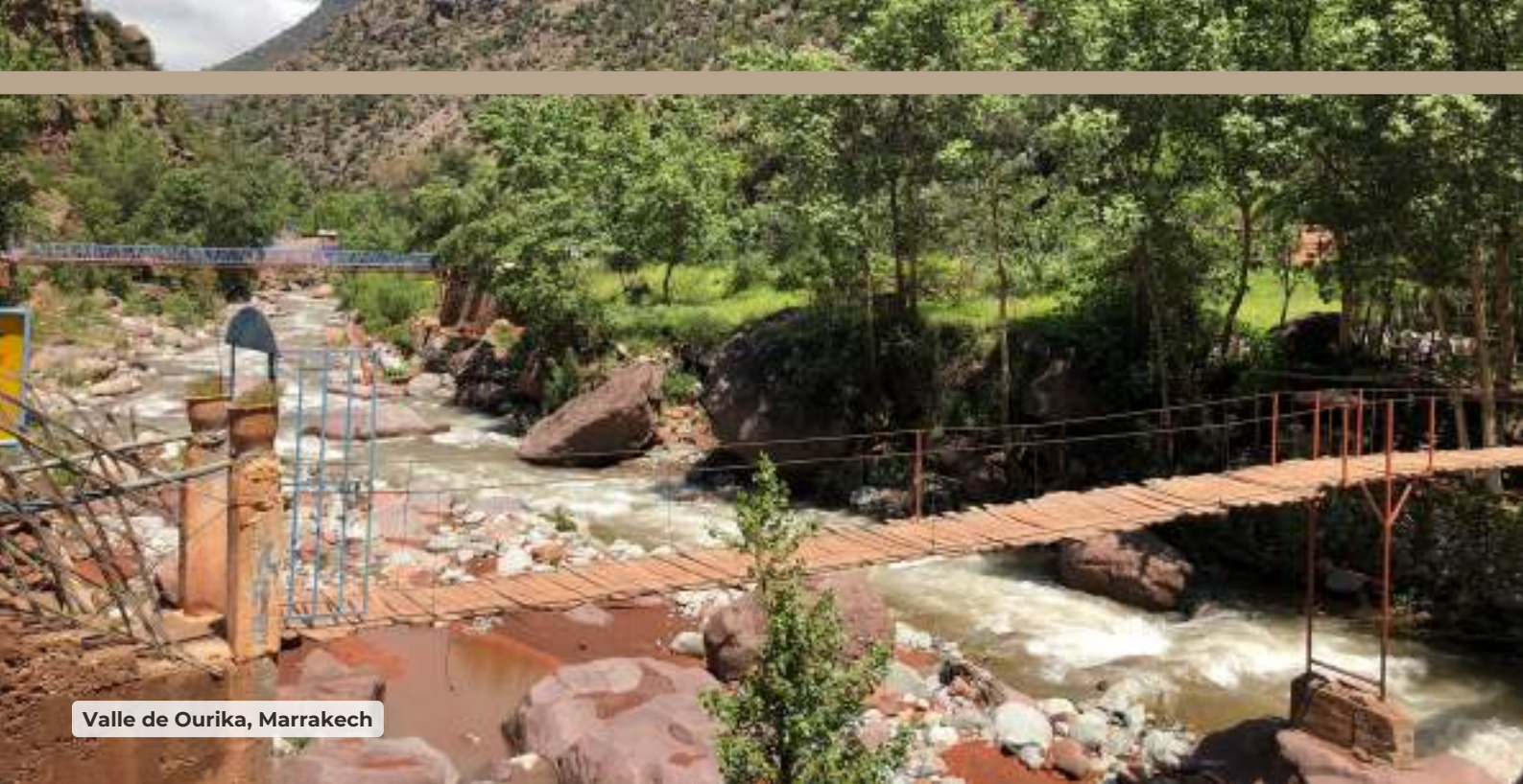
Valle de Ourika, Marrakech